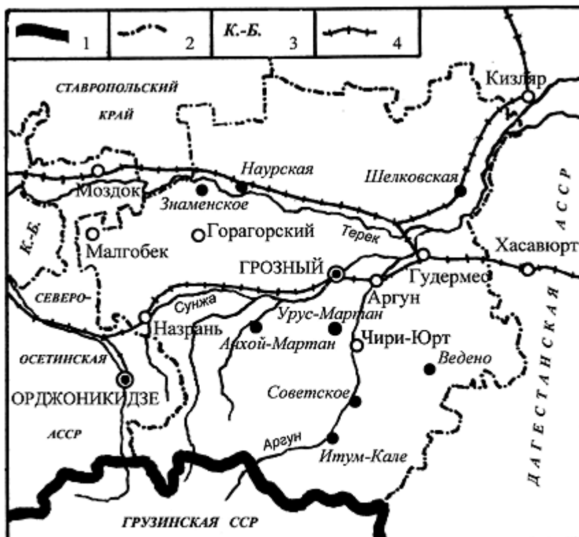
ЧЕЧЕНО-ИНГУШСКАЯ АССР в 1957-1991 гг.

Чечено-Ингушская АССР была восстановлена в несколько измененных границах. Ингушская территория вокруг города Владикавказа (т.н. Пригородный район) и полоса земли западнее города Малгобека остались в составе Северной Осетии, но зато республика получила часть Терско-Кумской низменности по левому берегу Терека, с расположенными там станицами.