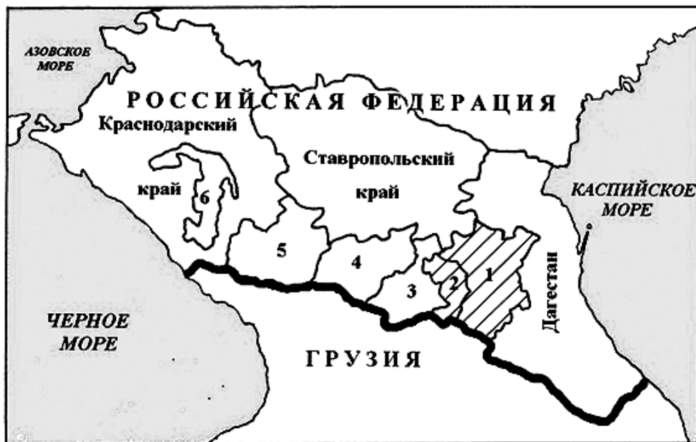
СЕВЕРНЫЙ КАВКАЗ И СТРАНА ВАЙНАХОВ (заштрихована)

Цифрами на схеме обозначены: 1 - Чеченская республика; 2 - Ингушетия; 3 - Северная Осетия - Алания; 4 - Кабардино-Балкария; 5 - Карачаево-Черкесия; 6 - Адыгея